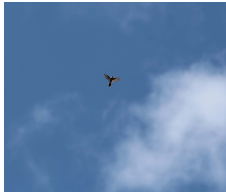
Ryc. 10. Pokrzewka wąsata, dolina Cervello, na S od Corte.