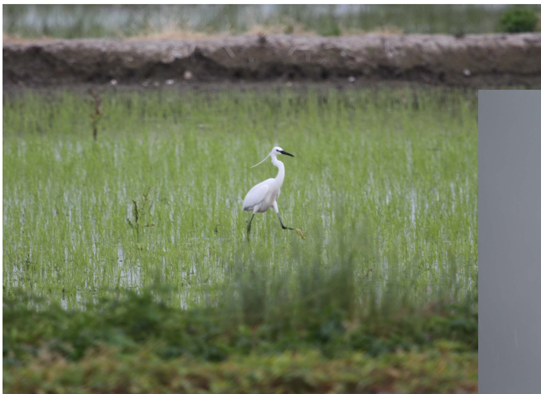
Fot. 14. Czapla nadobna – dolina rzeki Sesia (dopływu Padu). Oldenico, północne Włochy.