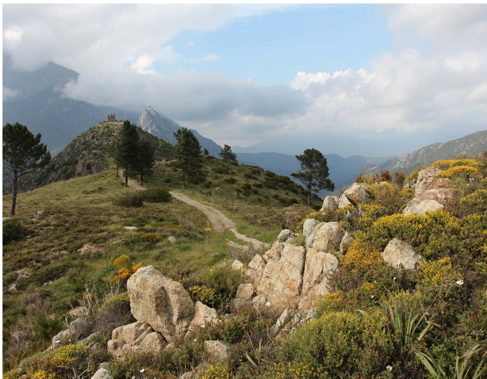
Fot. 11. Okolice Point du Vecchio na S od Corte. Siedlisko pokrzewki czarniawej, cierlika.