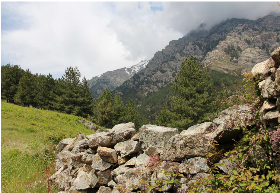
Ryc. 3. Dolina Cervello koło Corte. Miejsce obserwacji orłosepa, pokrzewki wąsatej, jerzyków alpejskich, jaskółek skalnych, orła przedniego, cierlików.