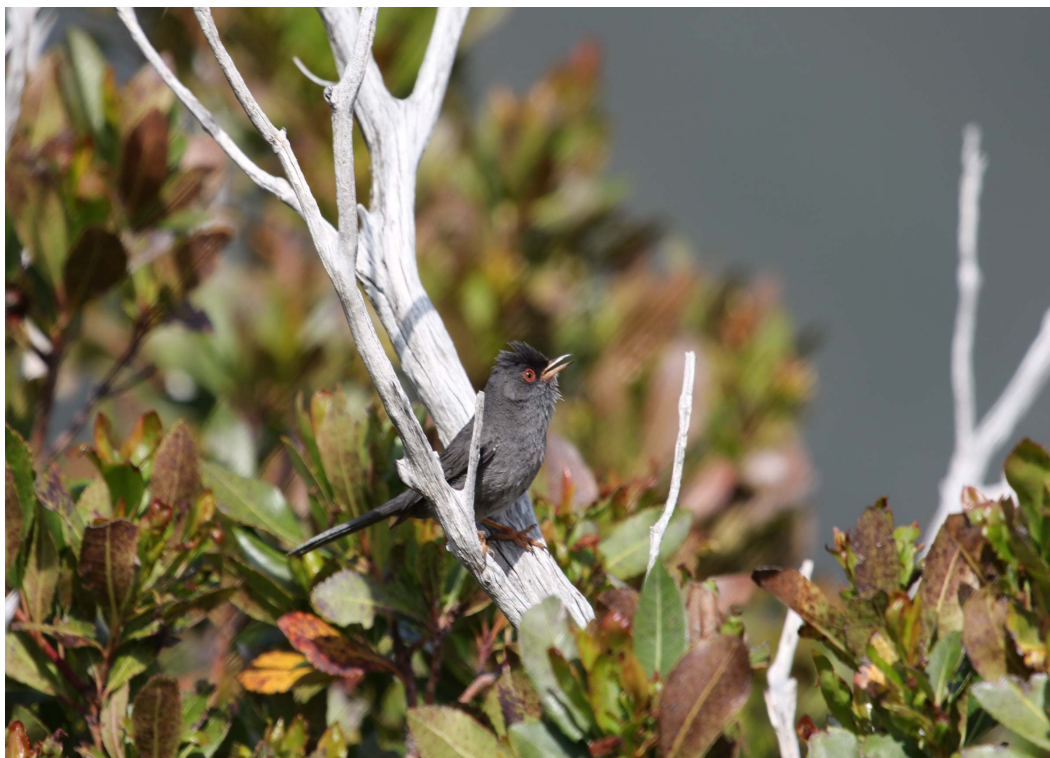
Ryc. 9. Pokrzewka czarniawa okolicy Point du Vecchio na S od Corte.