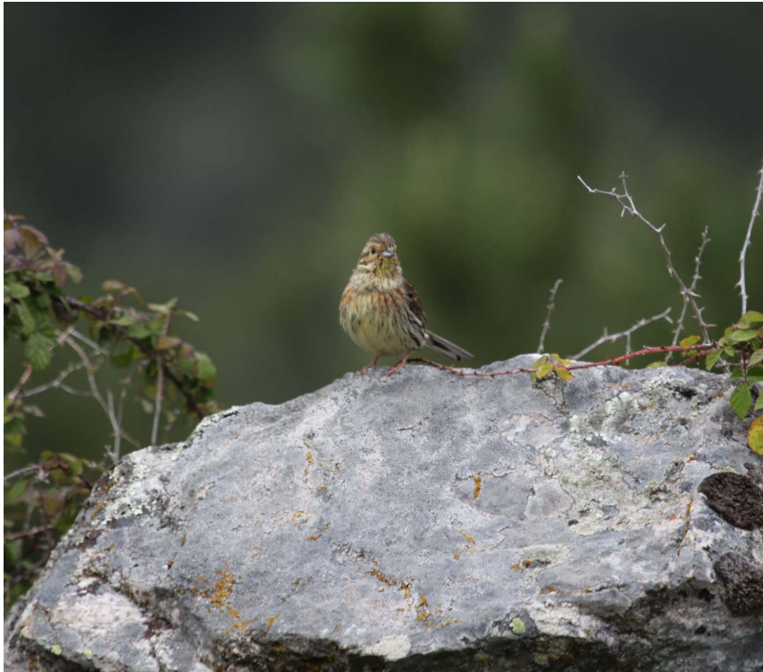
Fot. 5. Cierlik – samica.