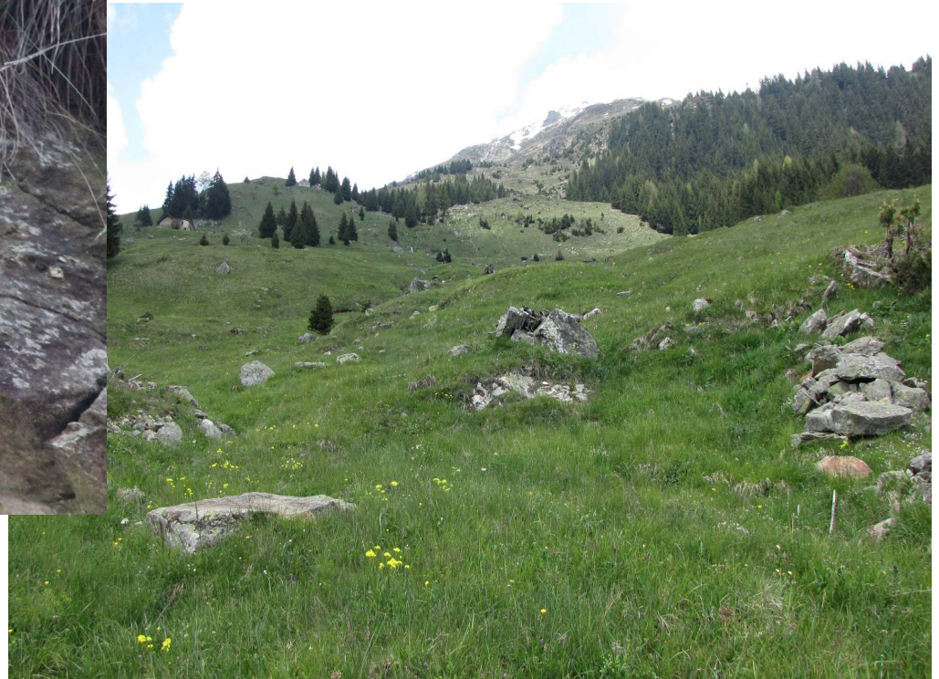
Fot. 18. Alpy, okolice Faido. Szwajcaria. Siedlisko nagórника, drozda obrożnego.