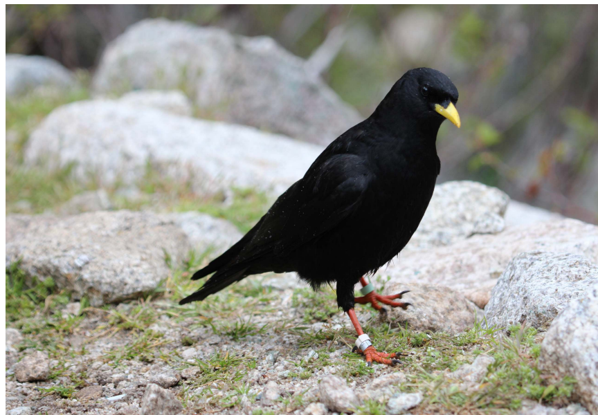
Fot. 2. Wieszczek – dolina Restonica, okolice Corte. Korsyka.