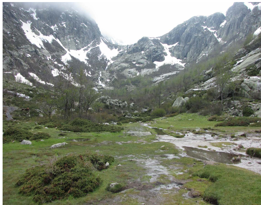
Ryc. 4. Dolina Restonica. Okolice Corte na SW. Miejsce obserwacji wieszczków, osetników korsykańskich, modraka, pluszcza, kowalika korsykańskiego.