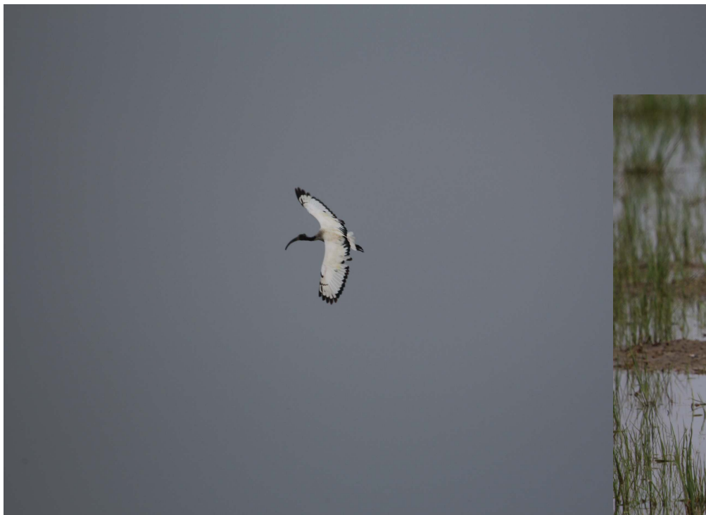
Fot. 13. Ibis czczony – dolina rzeki Sesia, Oldenico, północne Włochy. Pola ryżowe, łągi.