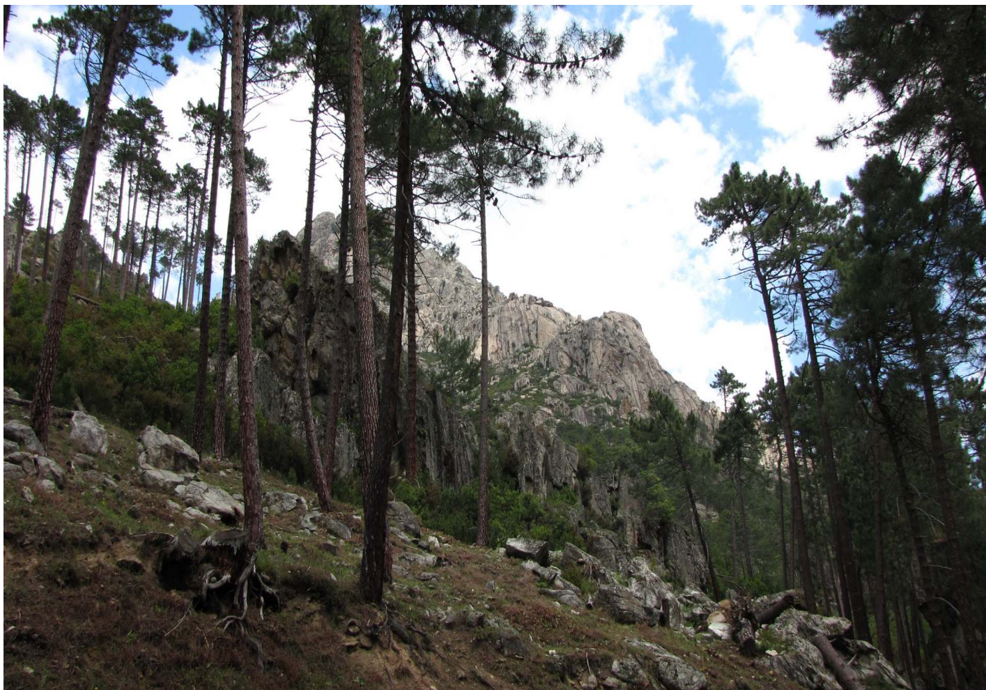
Fot. 19. Stare lasy sosnowe w dolinie Restonica koło Corte. Siedlisko kowalika korsykańskiego, zniczka, paszkota.