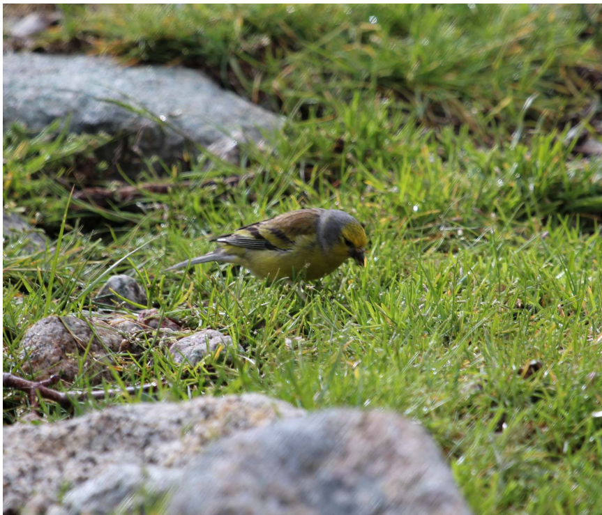
Fot. 7. Osetnik korsykański, dolina Restonica.