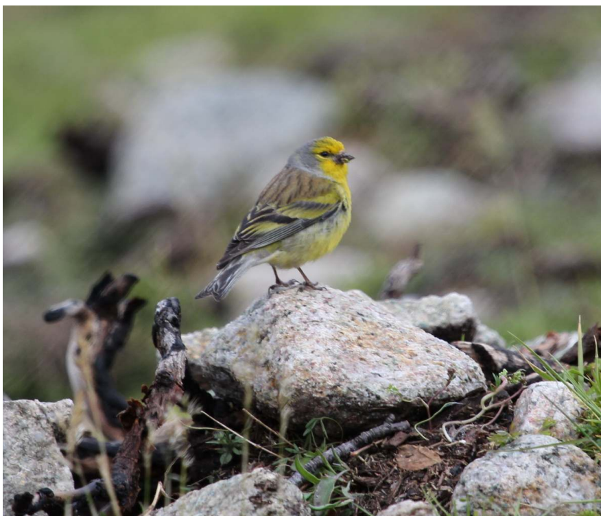
Fot. 8. Osetnik korsykański, dolina Restonica.