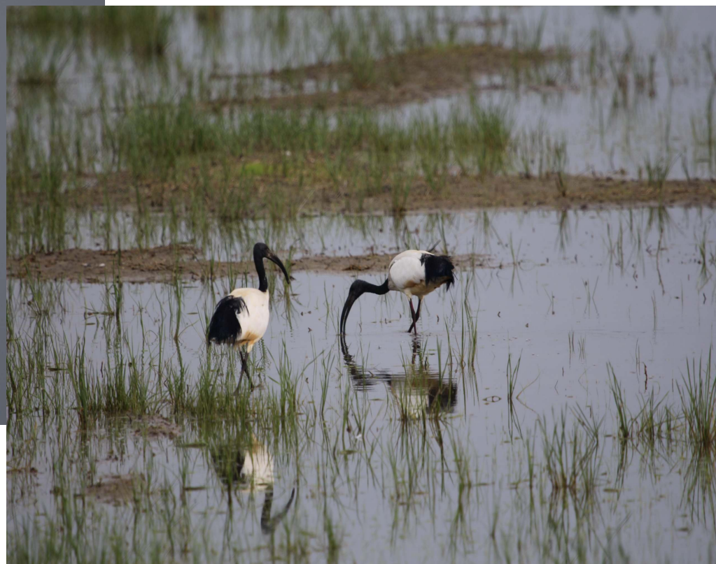
Fot. 15. Ibis czczony.