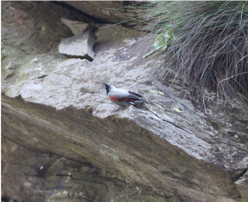
Fot. 17. Pomurnik, dolina Ticino, okolice Faido. Szwajcaria.