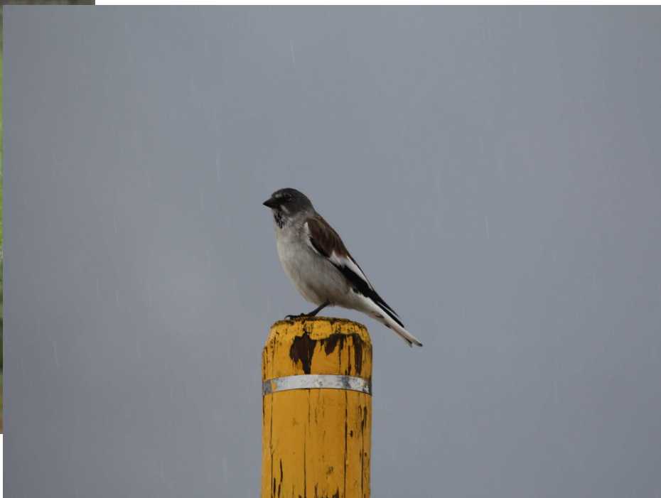
Fot. 16. Śnieżka, przełęcz św. Gotarda, Szwajcaria