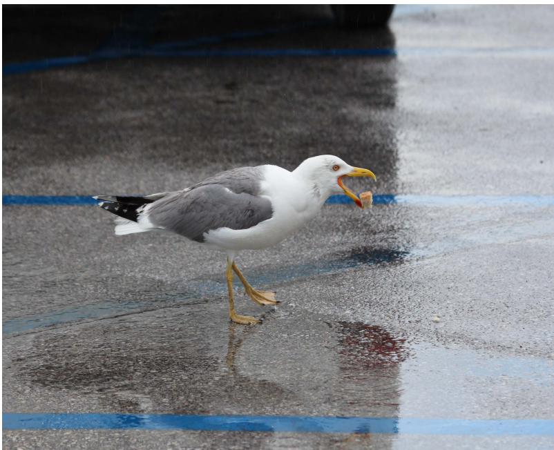
Fot. 1. Mewa romańska w porcie w Livorno. Włochy.