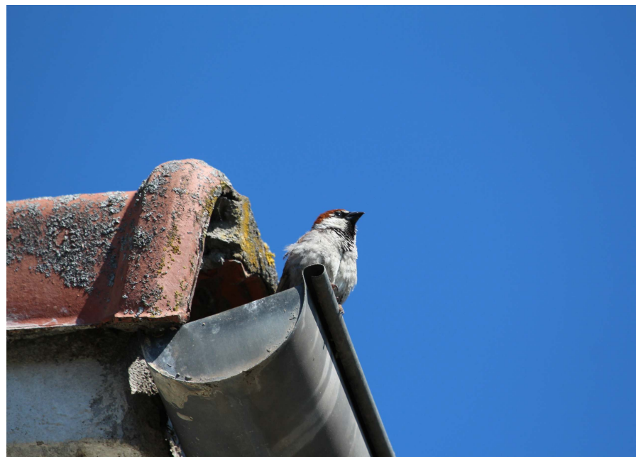
Fot. 12. Wróbel apeniński – Corte.