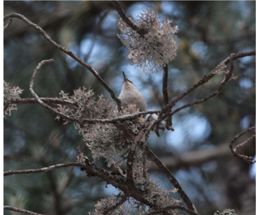
Fot. 6. Kowalik korsykański – kemping w dolinie Restonica.