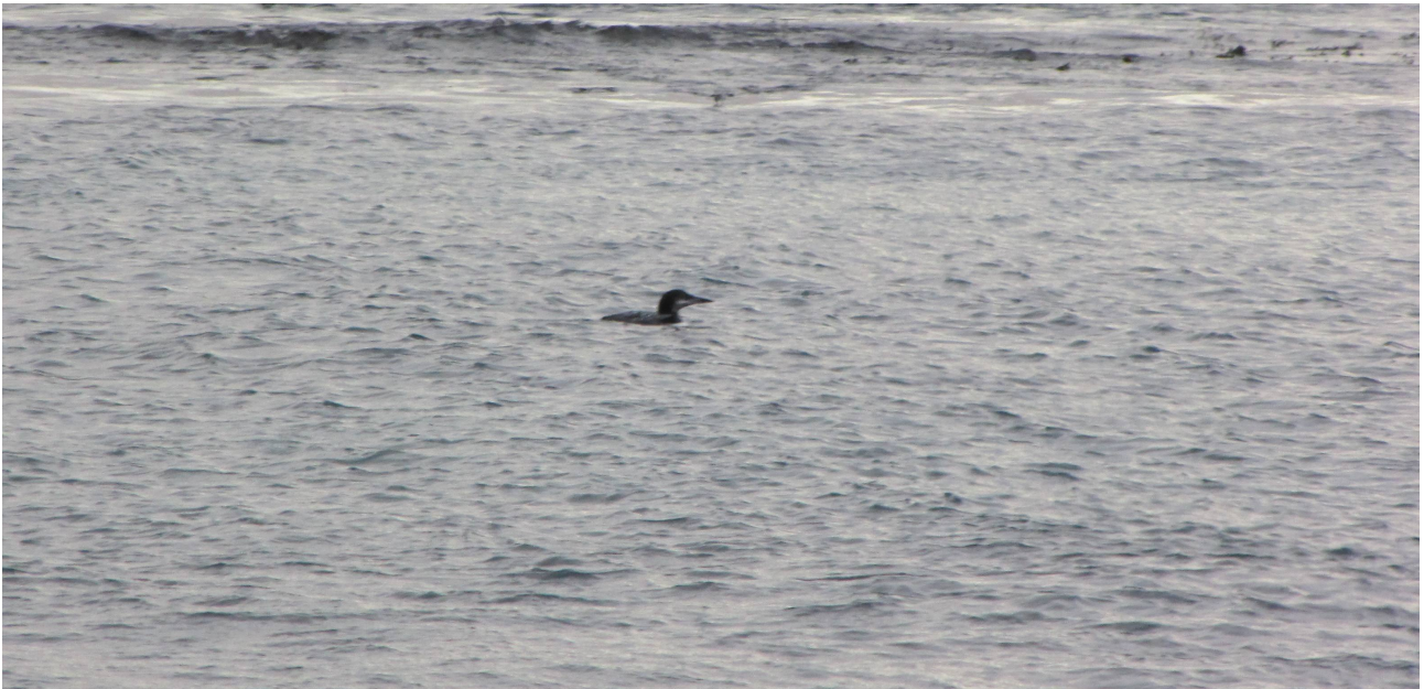
Fot. 7. Lodowiec, port Hafnir.