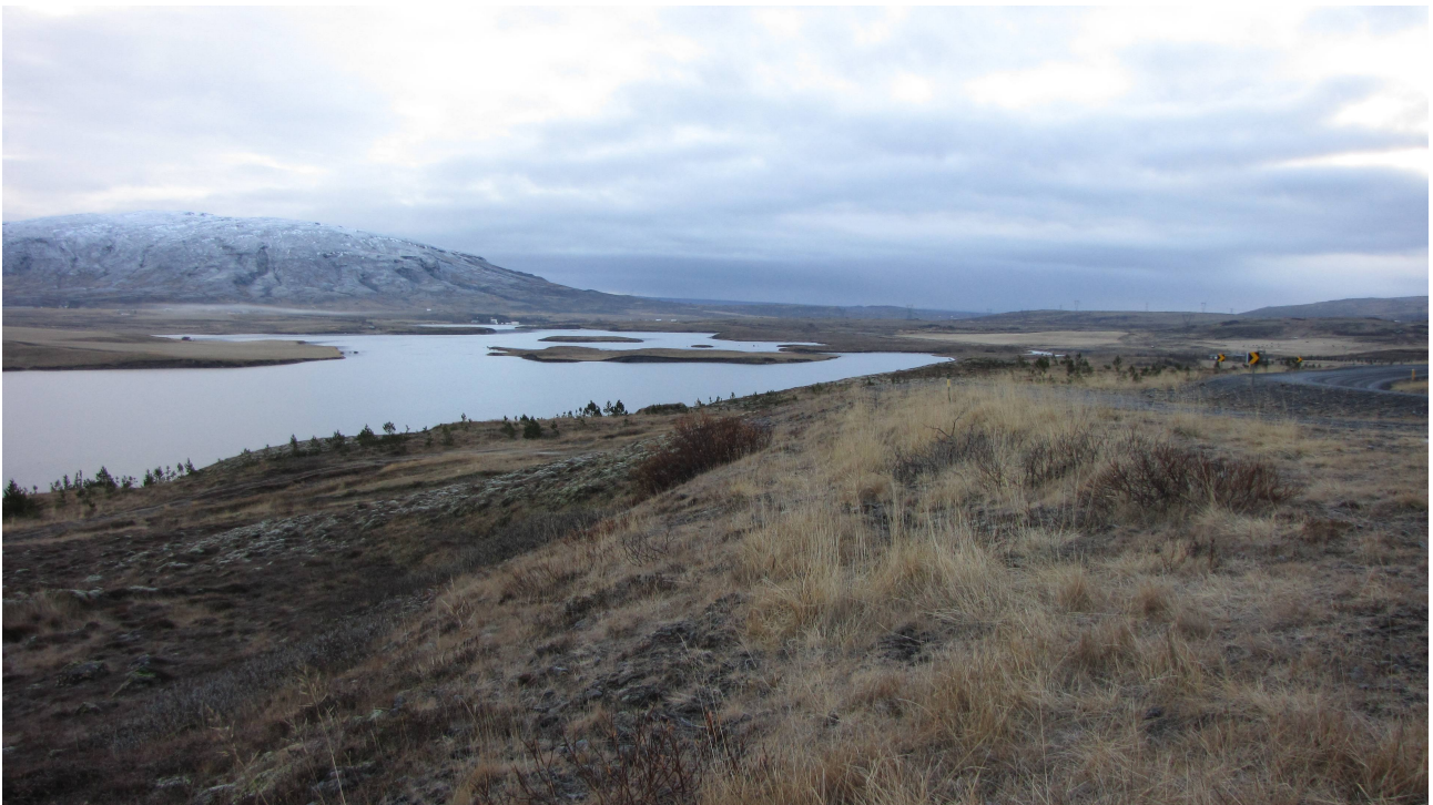
Fot. 9. Jezioro Ulfjotsvatn – miejsce obserwacji sierpca oraz pardw górskich na sąsiednich zboczach.