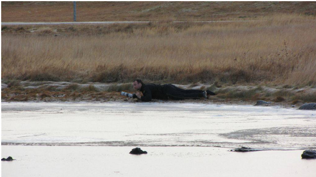
Fot. 3. Podchody islandzkiego ornitologa do mewy modrodziobej :)