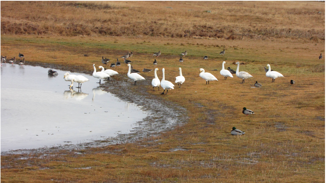
Fot. 10. Reykiavik, Bakkatjorn (rezerwat) wybrzeże.