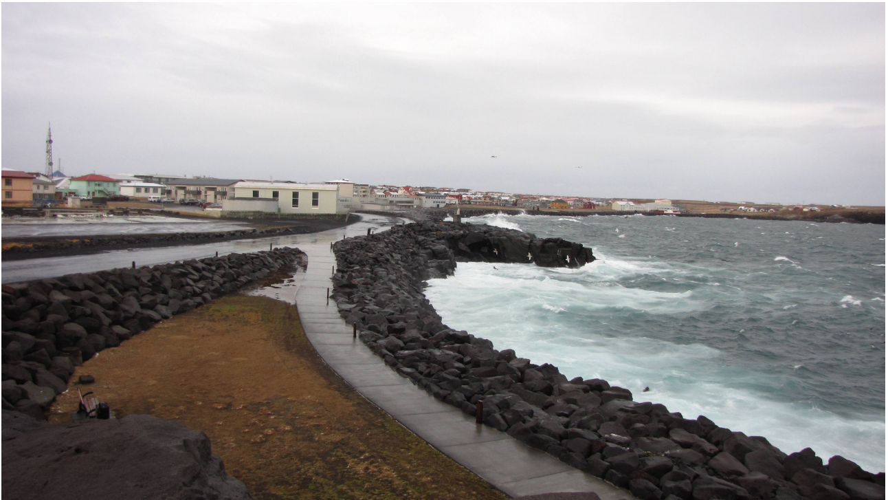
Fot. 6. Sztormowa pogoda i nabrzeże w Keflaviku.