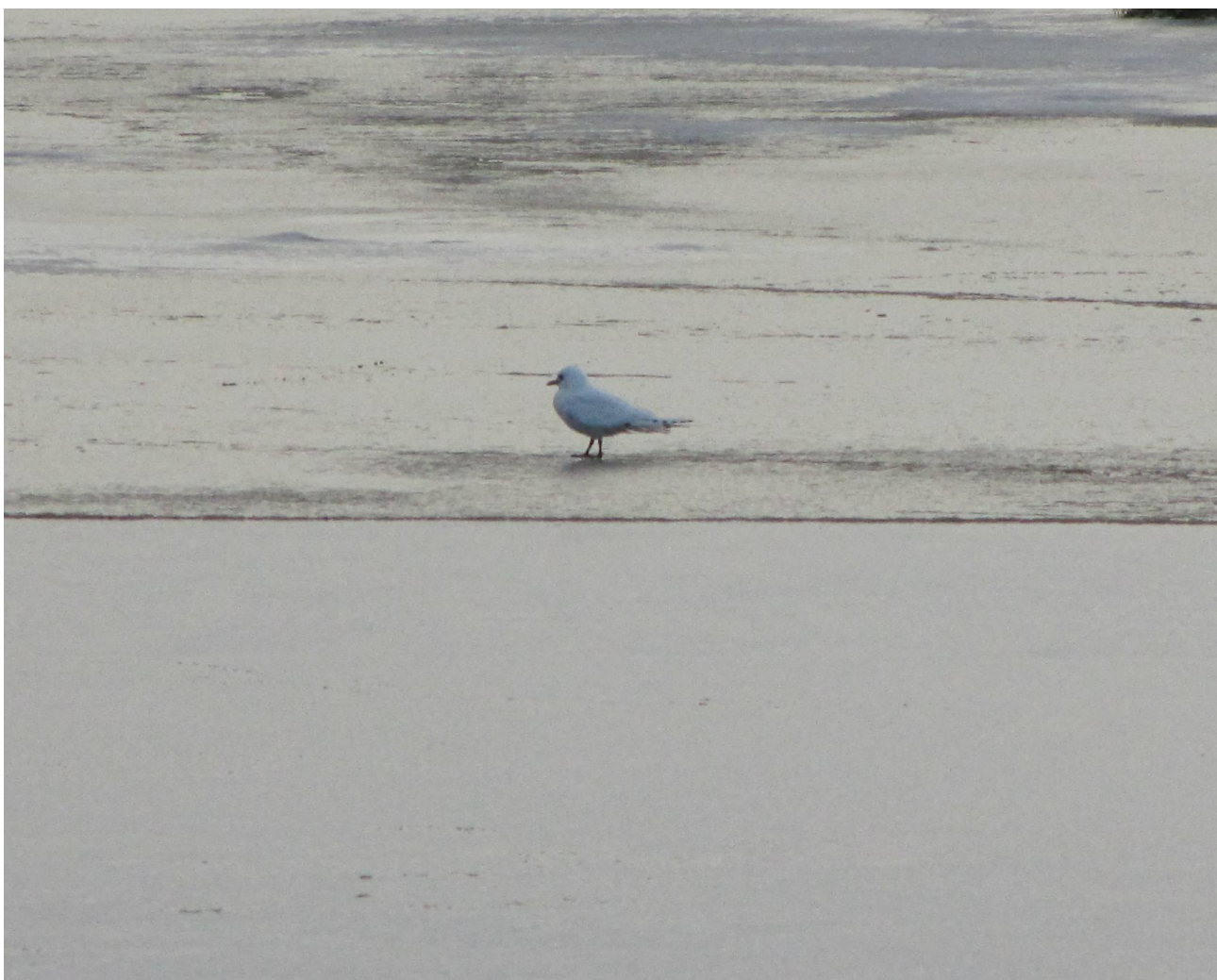
Fot. 1. Młodociana mewa modrozioba. Laguny, Njardvik.