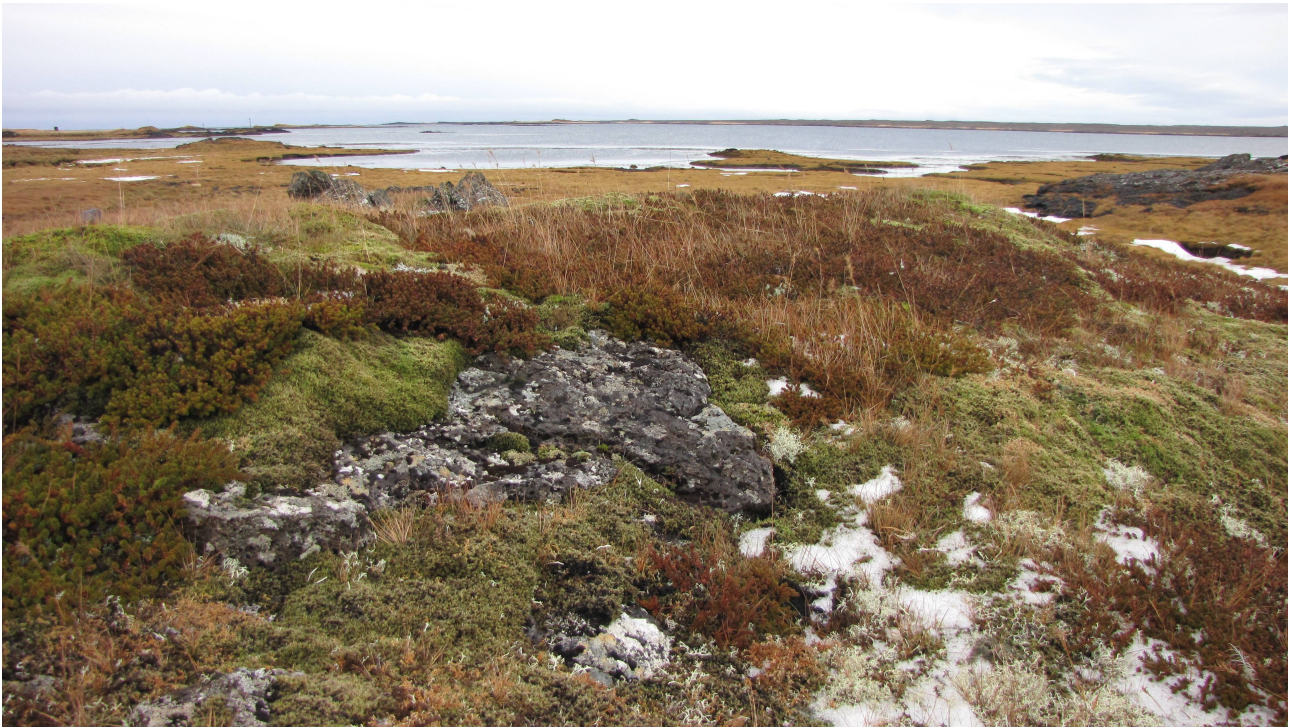
Fot. 8. Tundra u wybrzeży w okolicach Hafnir.