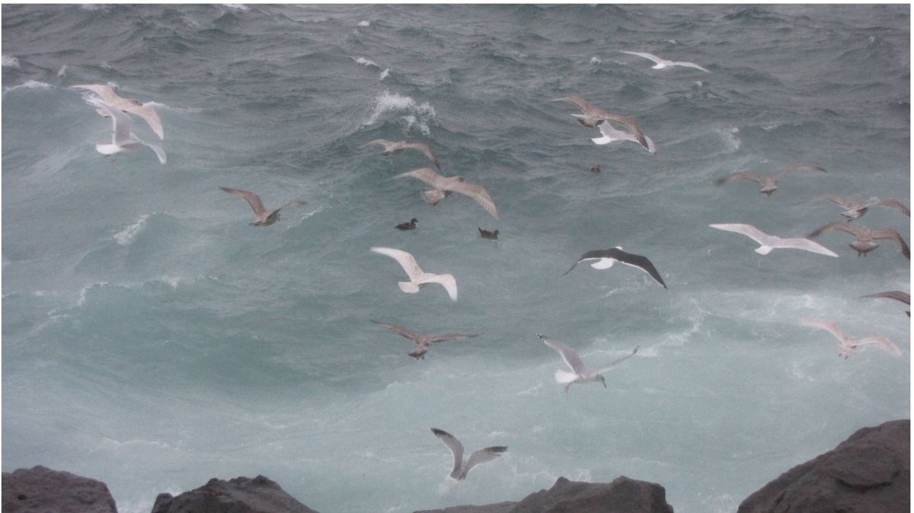
Fot. 5. Różnorodność północnych gatunków mew.