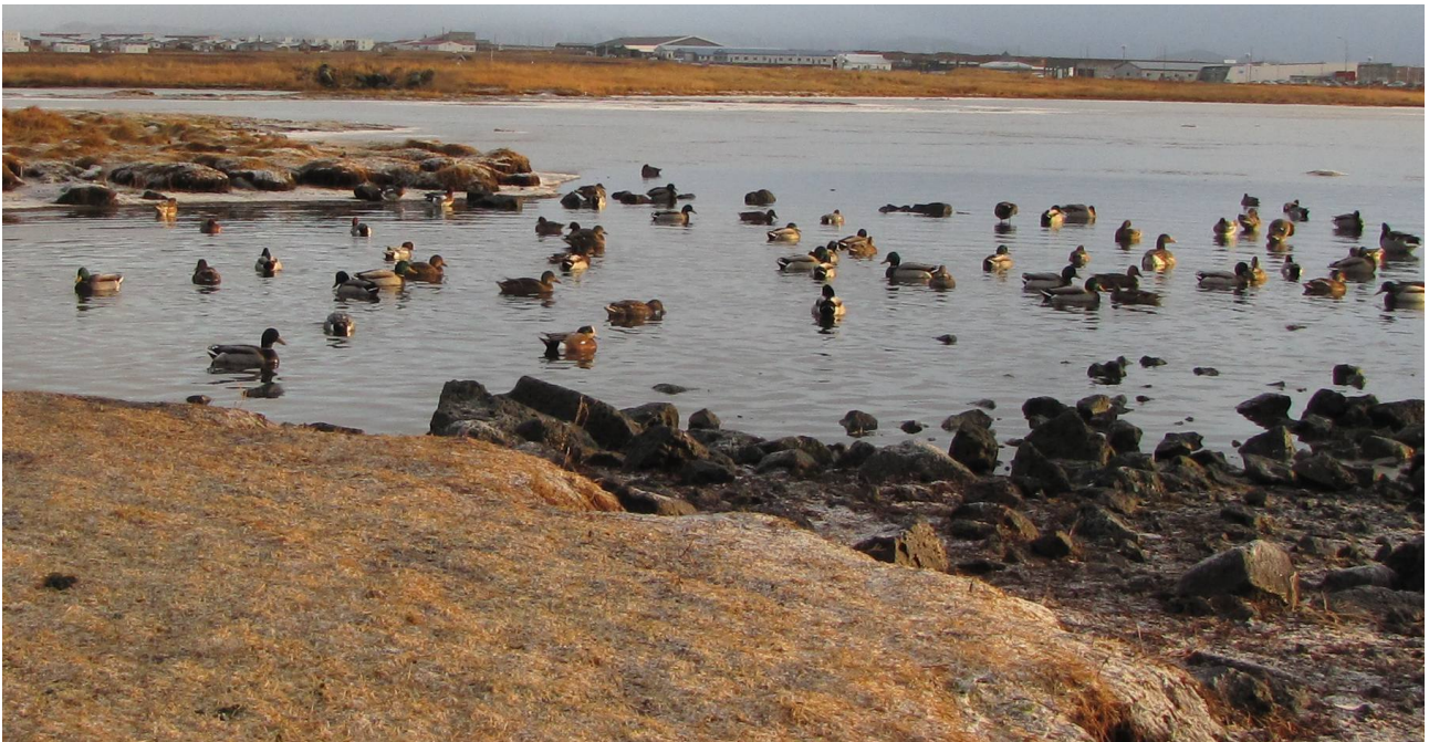
Fot. 2. Świstun amerykański w otoczeniu krzyżówek i świstunów.