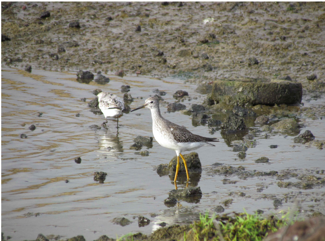
Fot. 19. Brodziec żółtonogi. Cabo do Praia