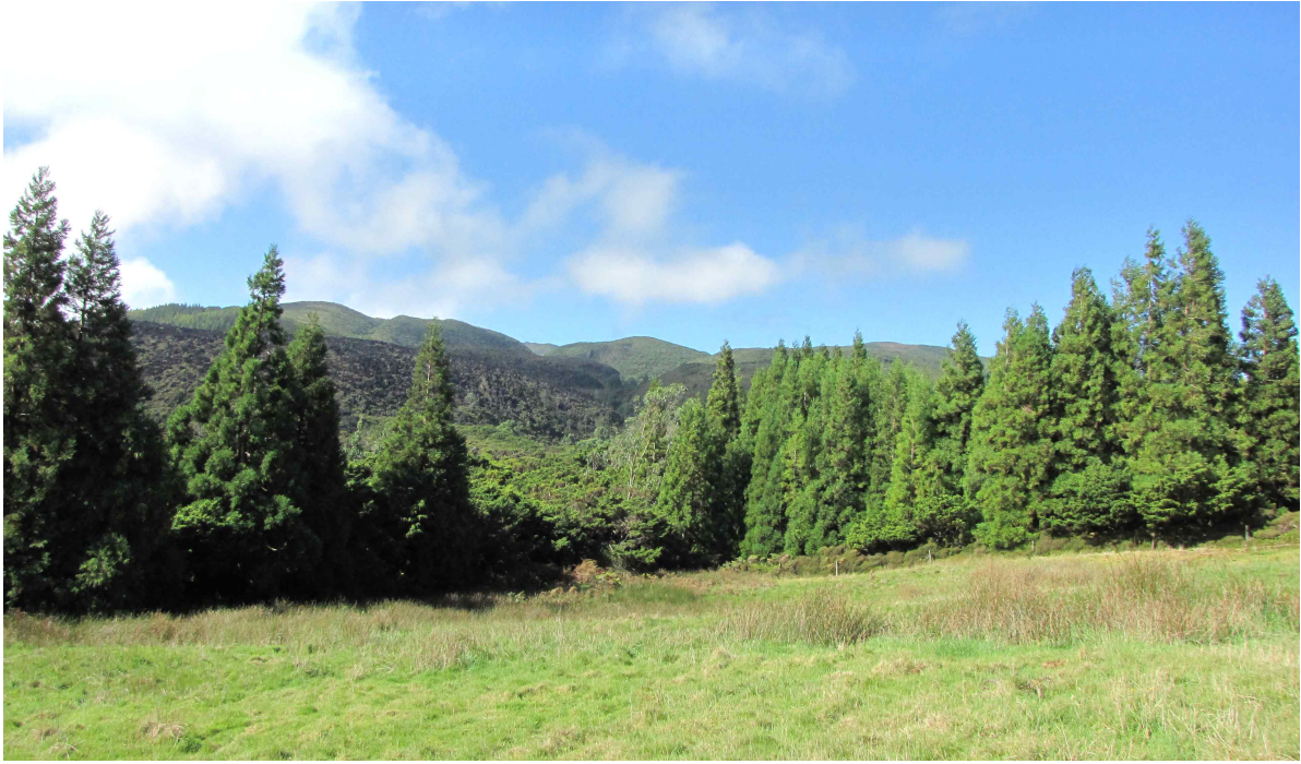
Fot. 6. Wnętrze wyspy