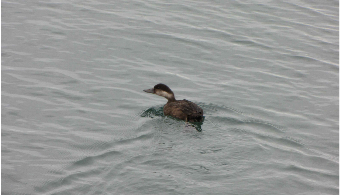
Fot. 14. Markaczka – 18 stwierdzenie dla Azorów :)