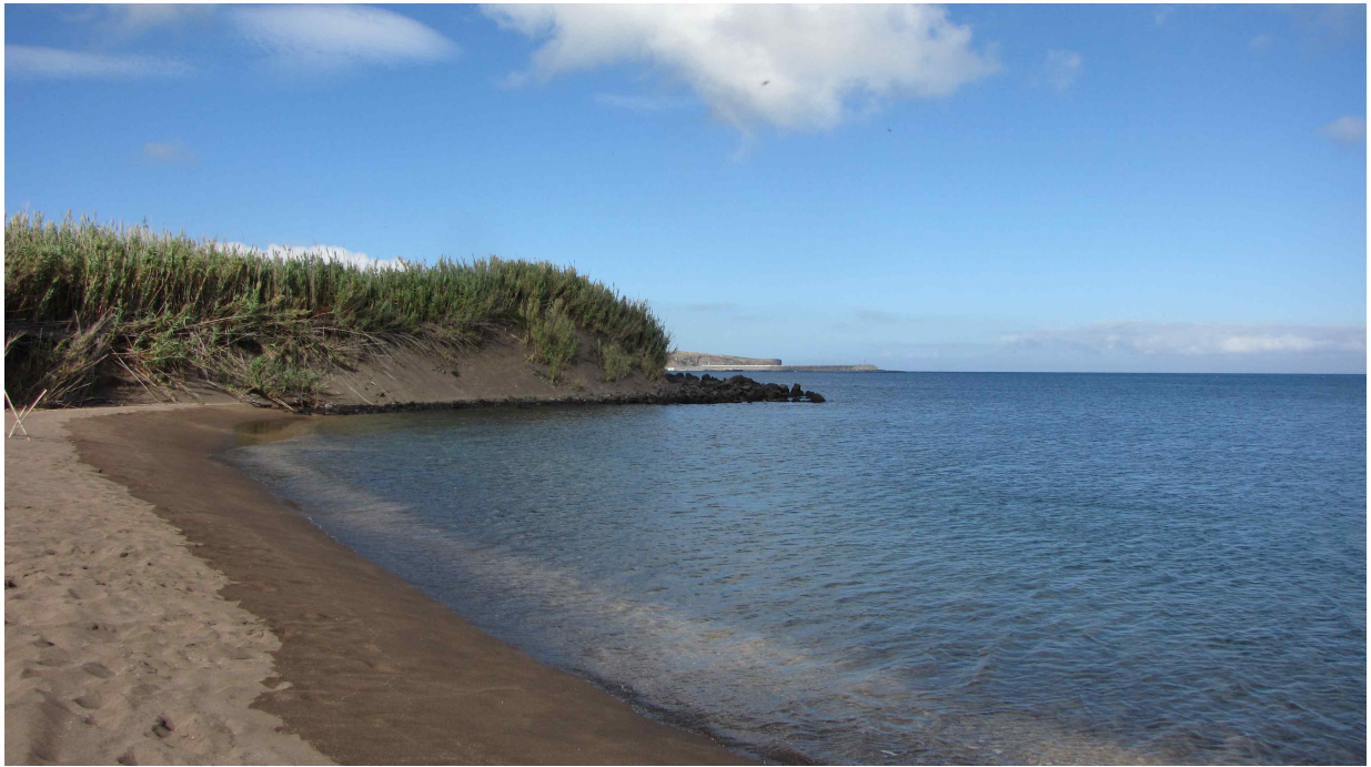
Fot. 8. Wybrzeże Cabo da Praia