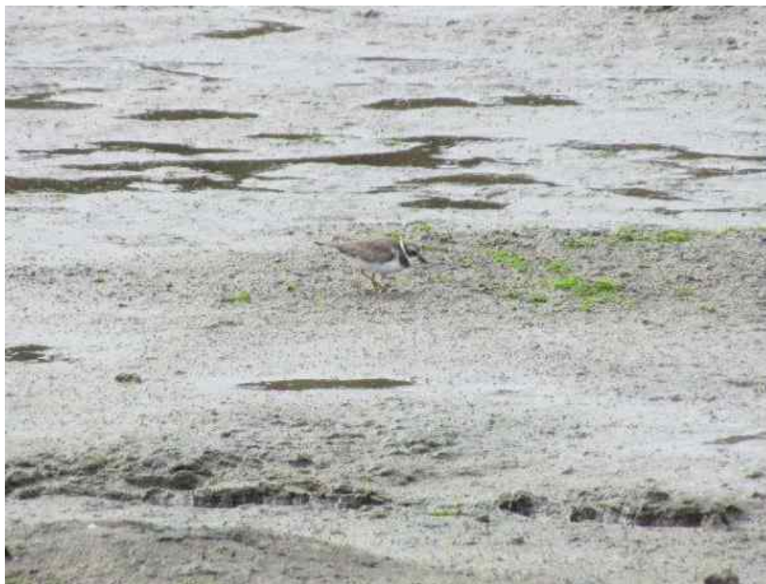
Fot. 23. Sieweczka skapopłetwa.