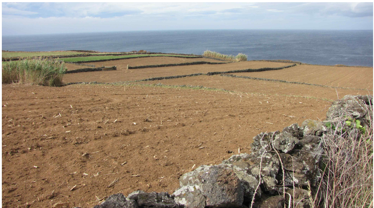
Fot. 9. Pola pod Raminho, północna część wyspy.