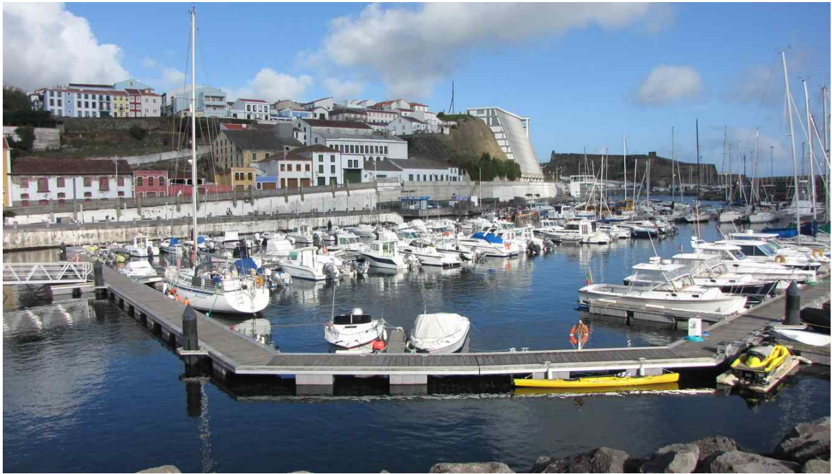
Fot. 4. Marina i port w Angra do Heroísmo