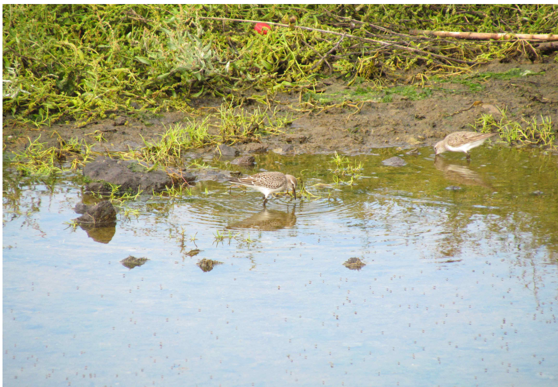
Fot. 22. Biegusy białorzytne – Cabo da Praia.