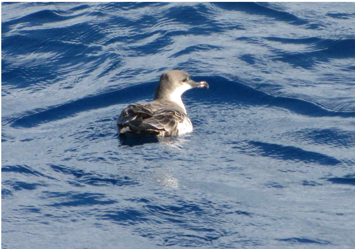
Fot. 16. Burzyk wielki.