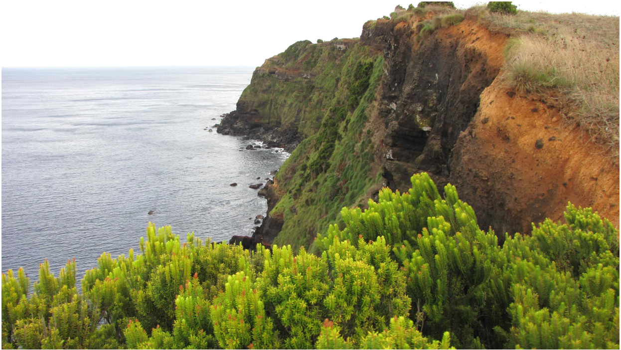
Fot. 10. Północna część wyspy.