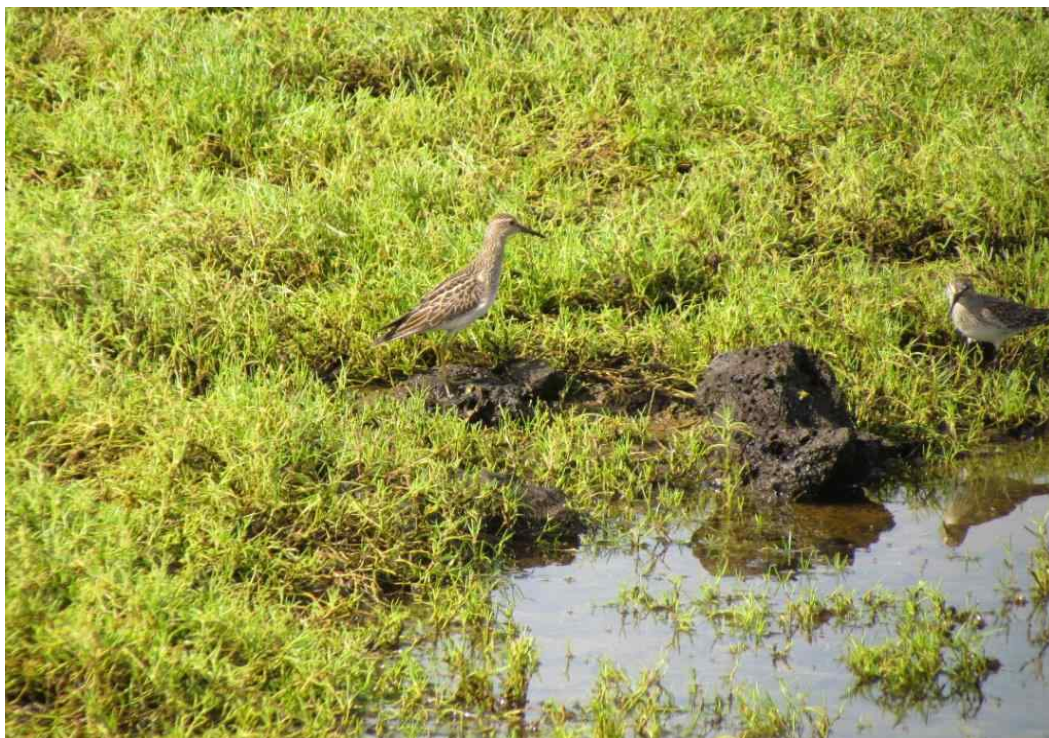
Fot. 24. Biegus arktyczny.