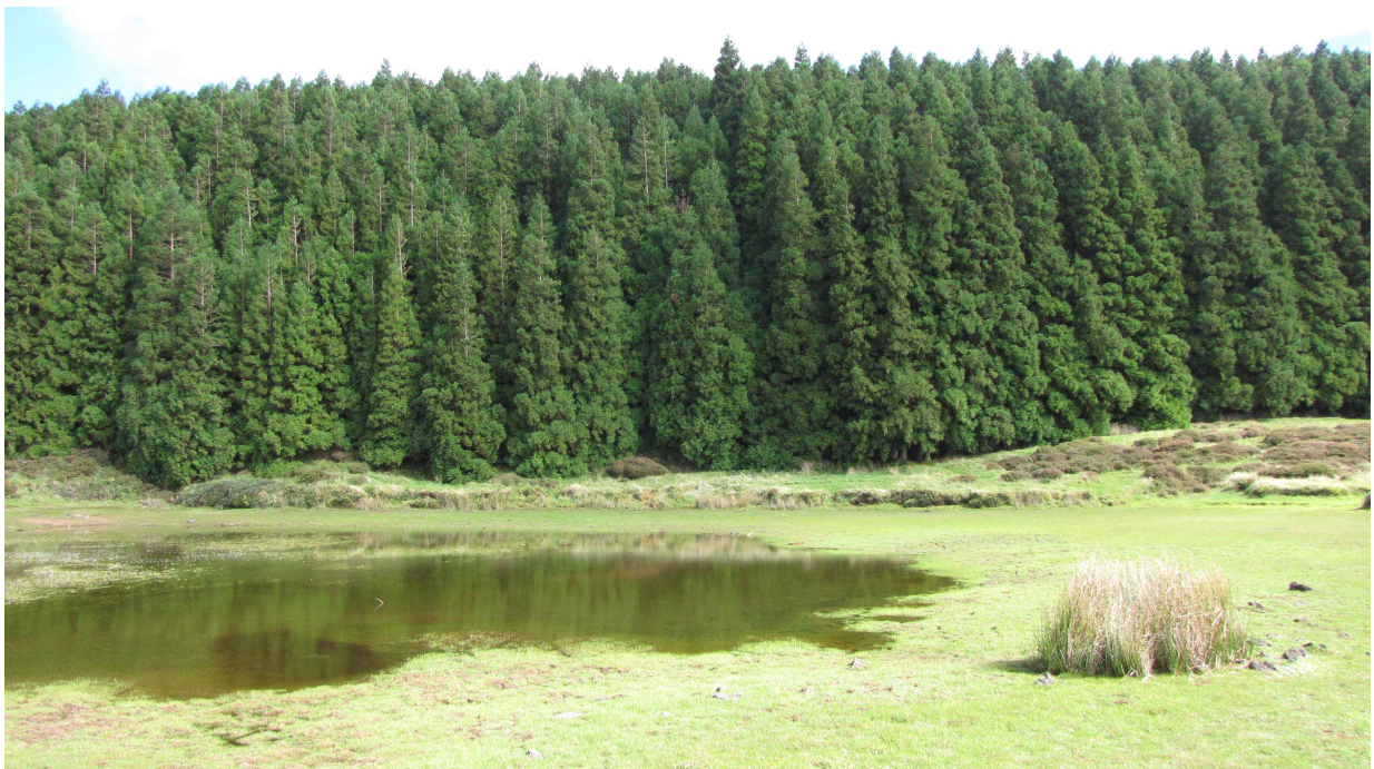
Fot. 5. Wnętrze wyspy