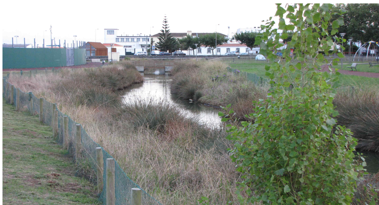
Fot. 13. Stawiki w Praia da Vitoria – obserwacja czapli modronosej.