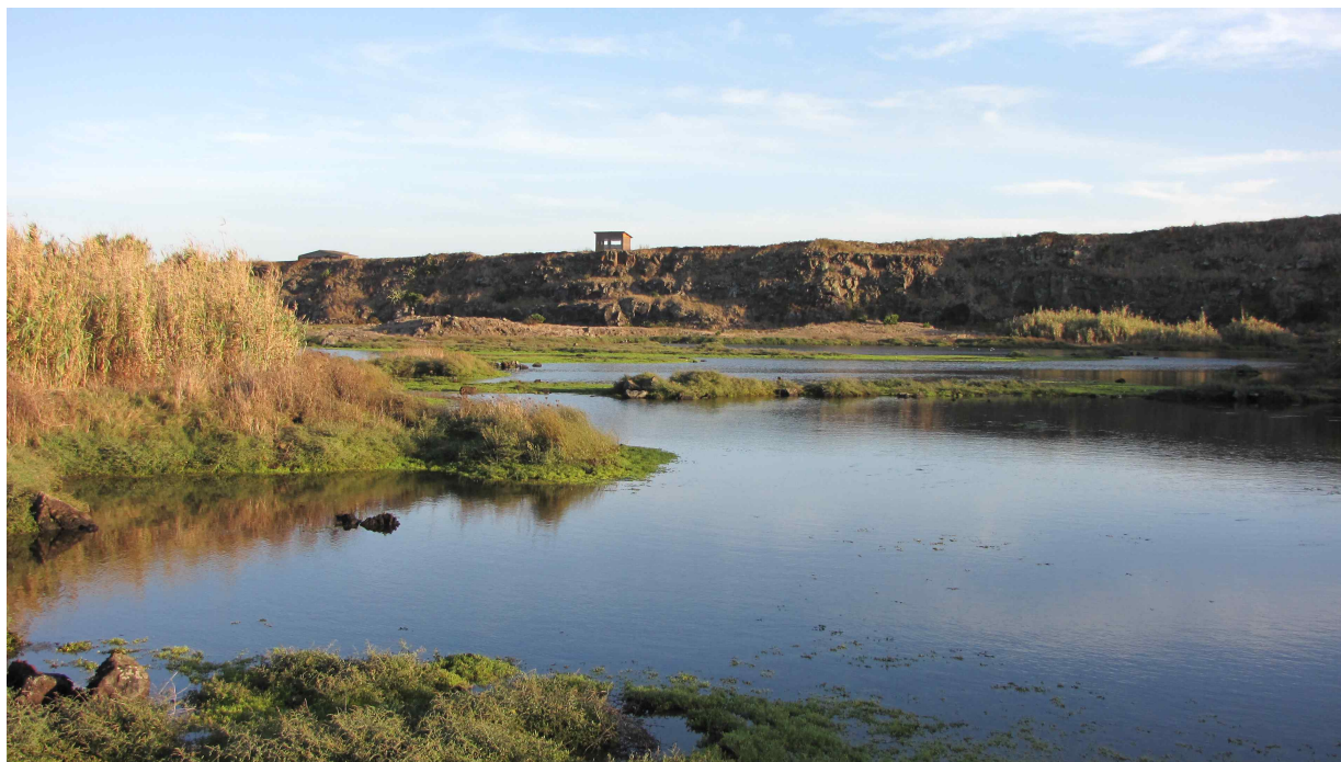
Fot. 2 i 2' Laguny Cabo da Praia