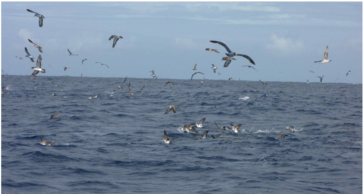
Fot. 15. Seawatching z pontonu :) około 2 tys burzyków dużych (żółtodziobych), 1 burzyk wielki, 2 burzyki północne.