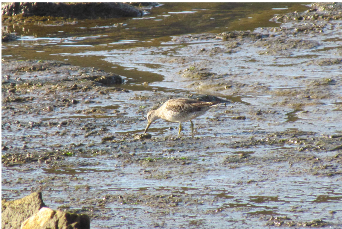
Fot. 21. Szlamiec krótkodzioby – Cabo da Praia.