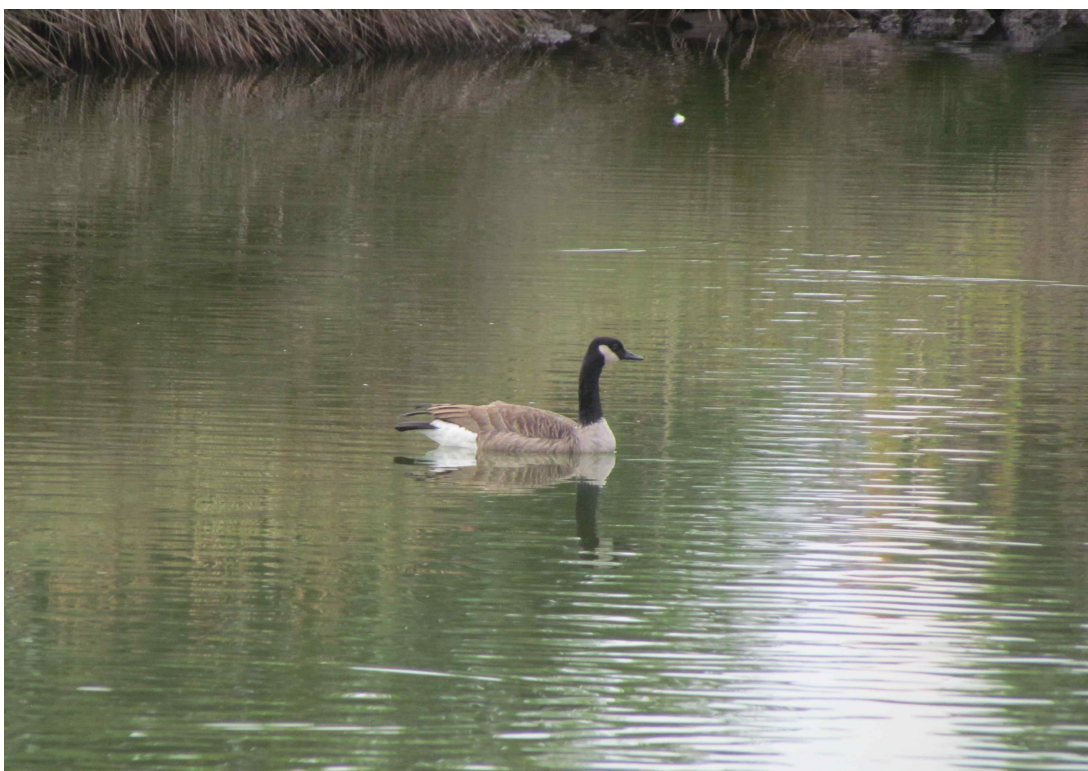
Fot. 17. Bernikla kanadyjska – stawiki w Praia da Vitoria.