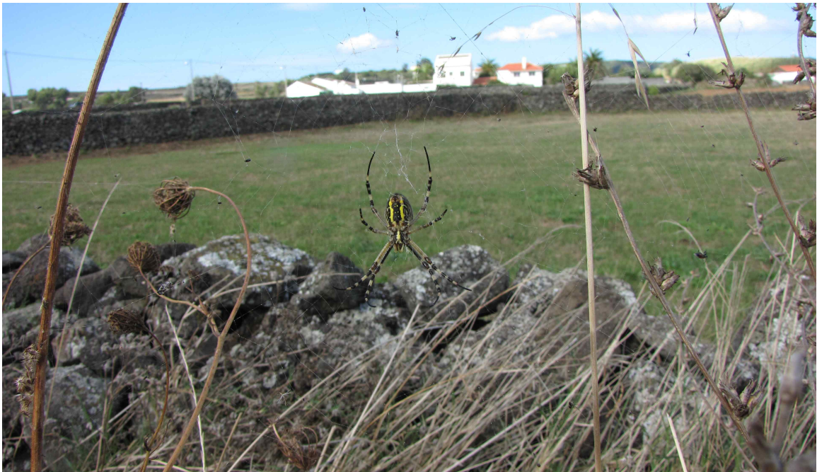
Fot. 7. Pola i wybrzeże w Cabo da Praia