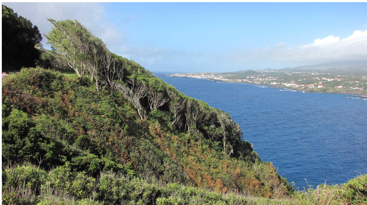
Fot. 12. Rezerwat Brasileiros w Angra da Heroísmo