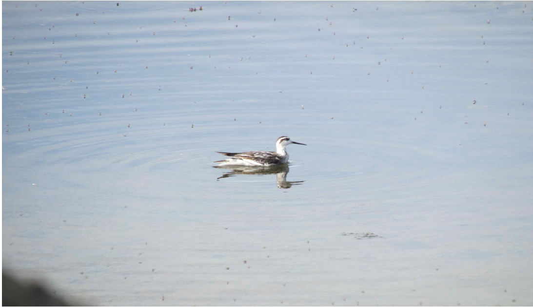
Fot. 18. Płatkonóg szyłodzioby – laguny Cabo da Praia