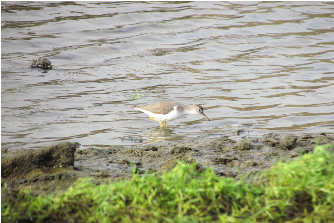
Fot. 20. Brodziec plamisty – Cabo da Praia