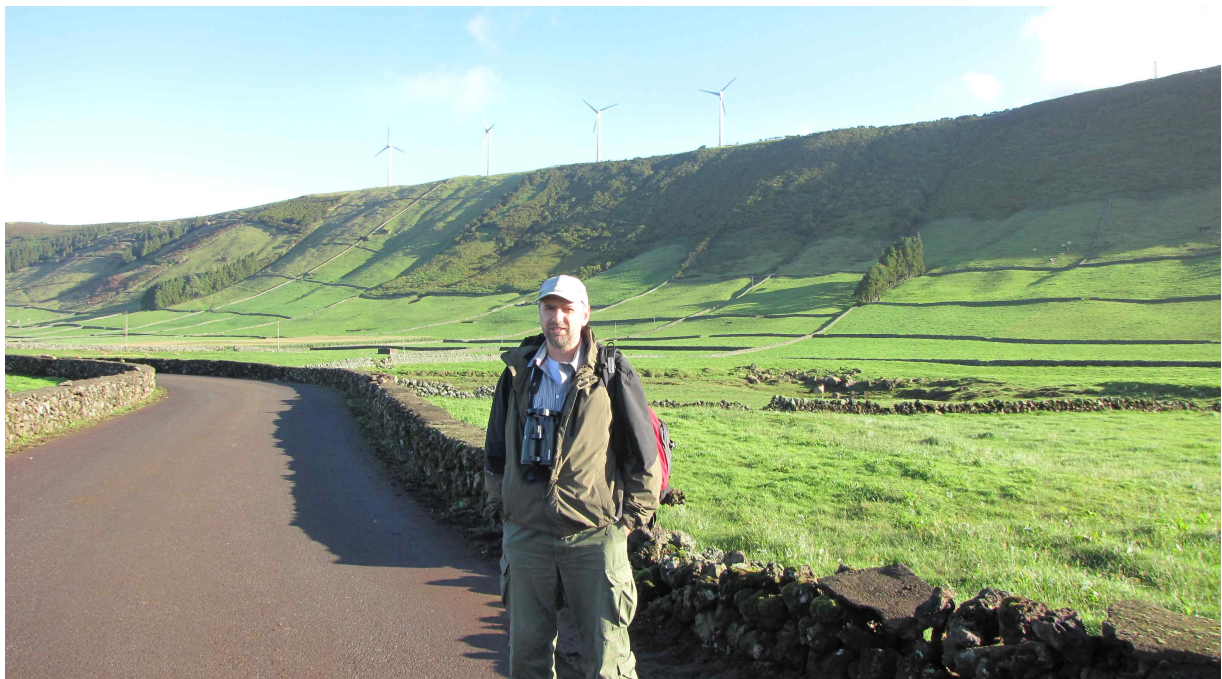
Fot. 11. Logoa do Junco. (Jacek Tabor)