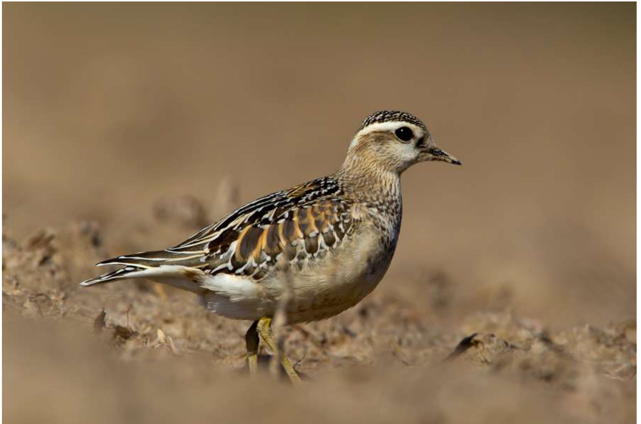
Mornel Charadrius morinelleus.

os. w Rakowiskach pod Białą Podlaską (C. Mitrus); 2011 – 16 os. koło Połazi w gminie Liw (Z. Kasprzykowski); 8 X 2017 - 1os. koło Somianki (M. Jobda i R. Rzepkowski) oraz 19 X 2013 – 1 os. koło Rupina (A. Goławski i E. Mróz).