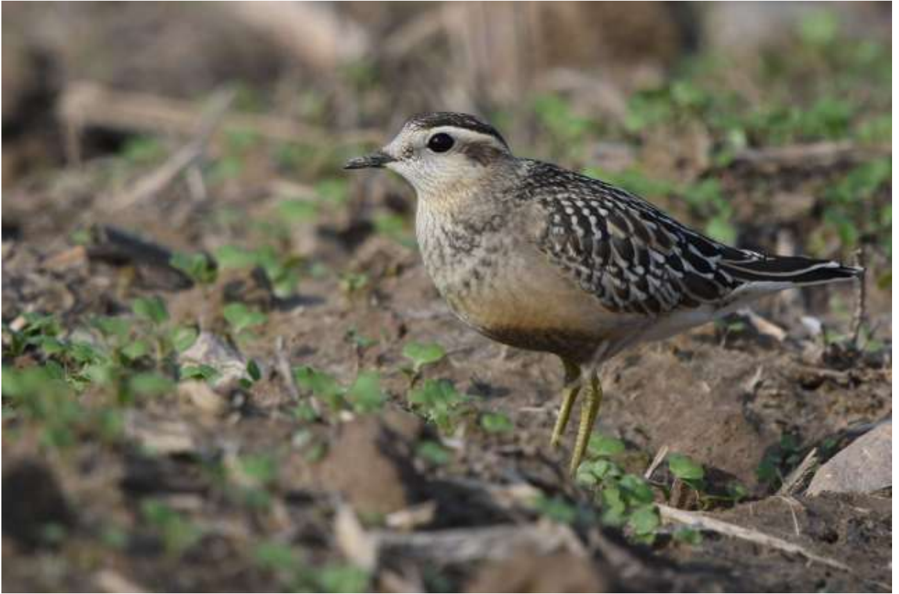
Mornel Charadrius morinelleus (Fot. M. Rowicki).