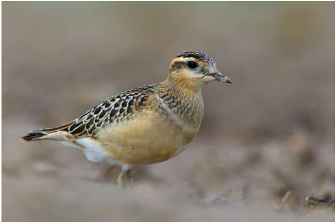
Mornel Charadrius morinelleus (Fot. P. Waclawik).

Okres przebywania. Na ogół ptaki przebywały bardzo krótko, bo jeden dzień, czasami stada koczowały 2-3 dni na rozległych polach. Najdłuższy pobyt zarejestrowano w dniach 26 VIII – 16 IX 2018 - stado 23 os. pod Kozłowem (K. Antczak i in.) raz w dniach 21 – 29 IX 2014 pod Przasnyszem, gdzie przebywało 5 juv. (M. Murawski i K. Antczak).