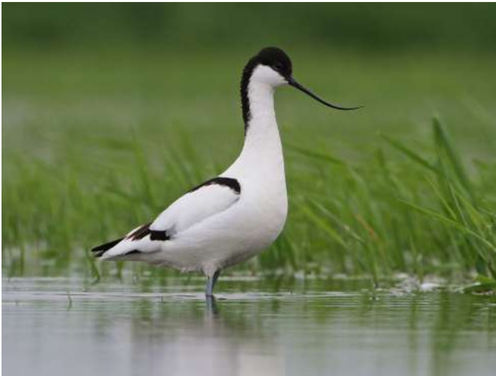
Szablodziób Recurvirostra avosetta nad Słudwią.

Środowisko. Gniazdujące ptaki stwierdzono nad Wisłą, na odstojnikach cukrowni oraz na śródpolnym zastoisku wody. Ptaki przelotne były stwierdzane na spuszczonej stawach rybnych, płycznach rzek, odstojnikach ścieków.