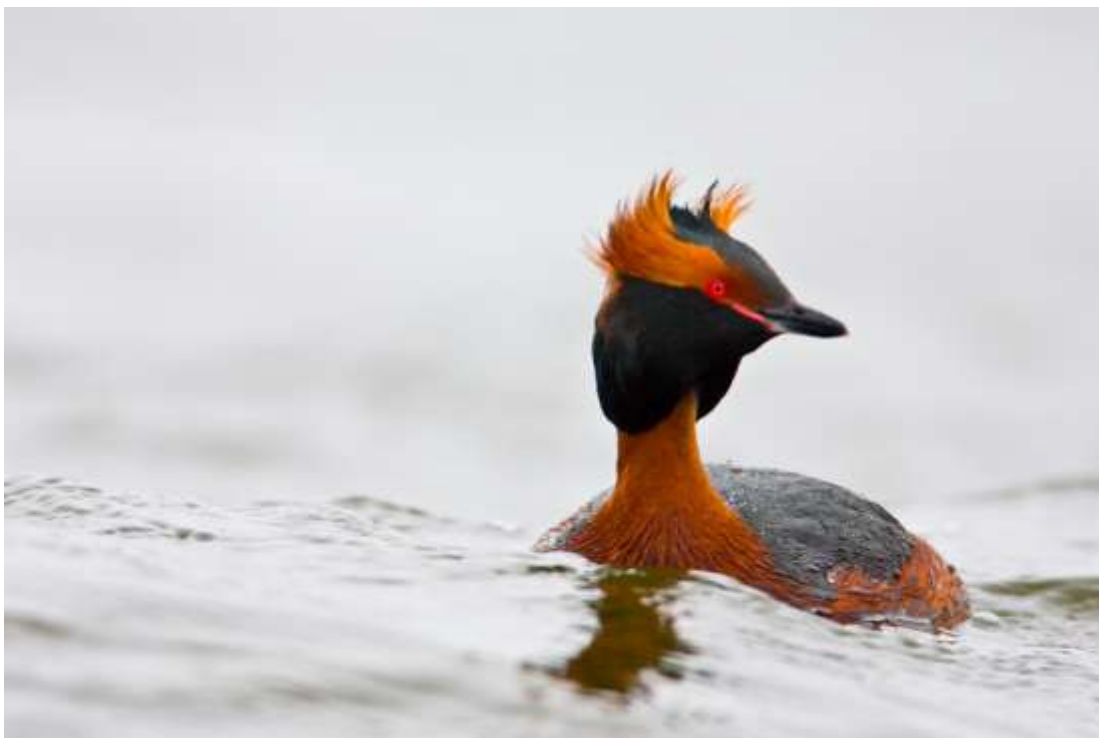
Perkoz rogaty Podiceps auritus

Środowisko. Spotykany głównie na stawach rybnych, gdzie był zarejestrowany 42 razy, w tym aż 12 razy na stawach w Siedlcach i 9 razy w Walewicach. Na zbiornikach zaporowych obserwowany 33 razy, w tym 32 razy na Zbiorniku Zegrzyńskim. Na rzekach widziany zaledwie 4 razy (Wisła i Narew) oraz jeden raz na osadnikach „Popioły” w Kozienicach i raz na J. Czerniakowskim w Warszawie.