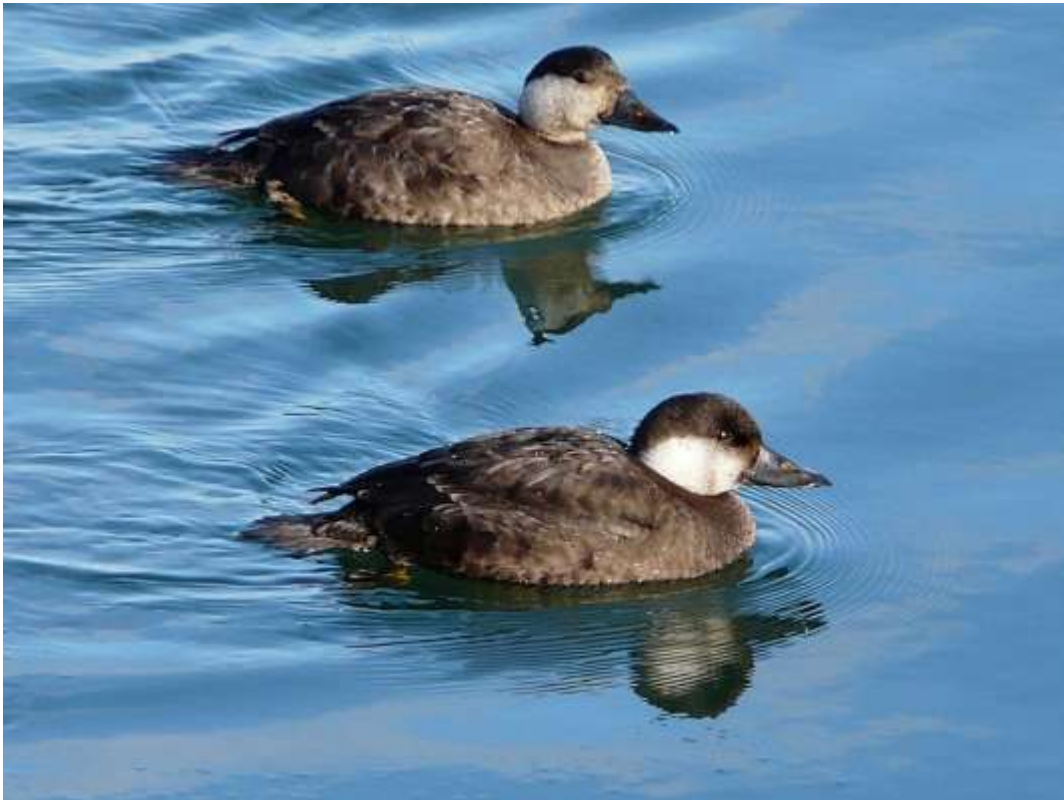
Samice markaczki Melanitta nigra

Środowisko. Markaczki stwierdzano najczęściej na zbiorniku Zegrzyńskim (80% spotkań) oraz na stawach rybnych (10%), pozostałych zbiornikach retencyjnych (5,2%), Wiśle (3,8,2%) i Bugu (1%).