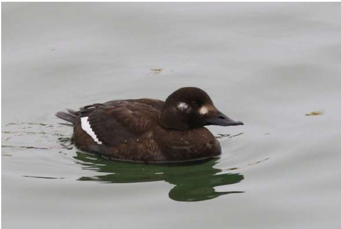
Samica uhli Melanitta fusca

Środowisko. Spotykana była głównie na zbiorniku Zegrzyńskim (79,7% obserwacji i 94 % osobników) oraz na Wiśle (9,7% i 3,8 %) i stawach rybnych (3,9% i 0,8 %). Ponadto uhle widywano na pozostałych, dużych rzekach: Pilicy (3,9% i 0,7%), Bugu (0,8% i 0,3%), Narwi (0,6% i 0,1%). Na żwirowniach spotkana 5-krotnie (1,4%) w łącznej liczbie 9 os. (0,3%). Widziano również ptaka zimującego na Kanale Łasica w Puszczy Kampinoskiej (A. Olszewski).