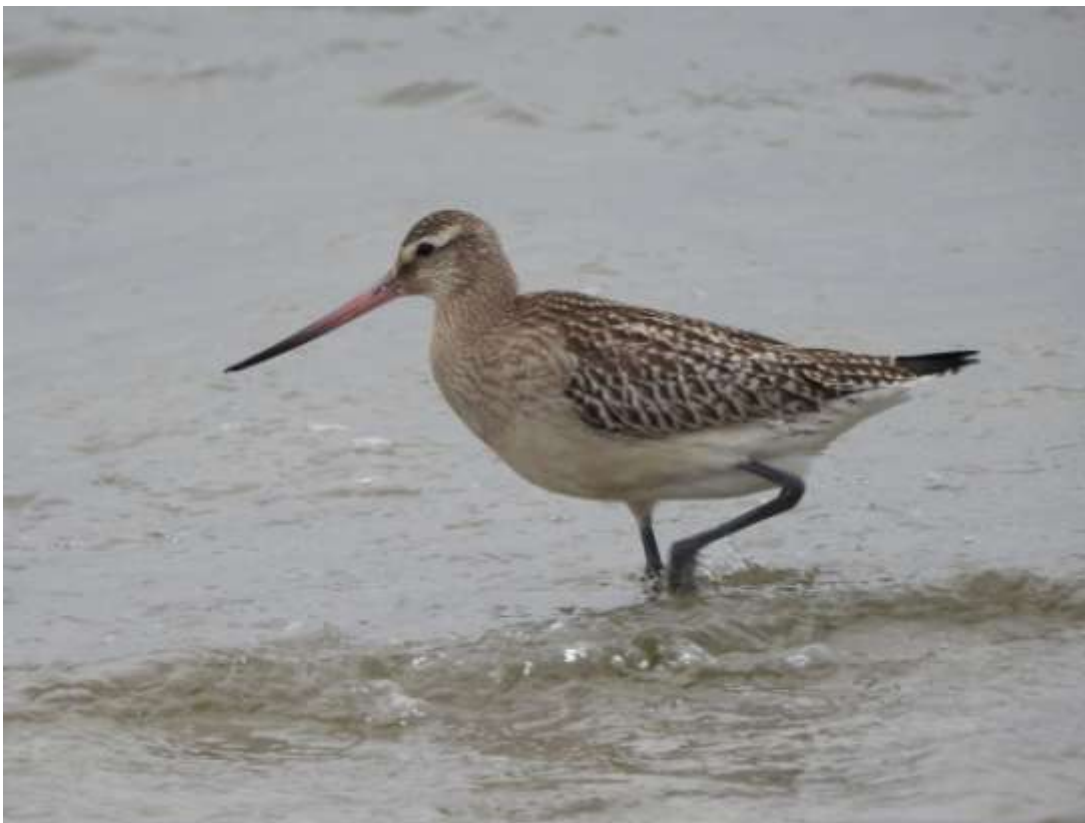
Szlamnik Limosa lapponica

Zmiany częstości pojawów. W XIX wieku nie był podawany (Taczanowski 1882, 1888). Przypuszczalnie był to gatunek przeoczony (?), bowiem był wówczas rejestrowany m. in. pod Lwowem. W latach 1975 - 2020 obserwowany łącznie 58 razy w liczbie 74 osobników, jakkolwiek nie był stwierdzony w latach 2018 i 2020.