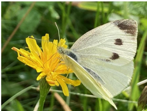
II miejsce - Bielonek pracujący przy zapylaniu kwiatów (Autor: Natalia Mika)