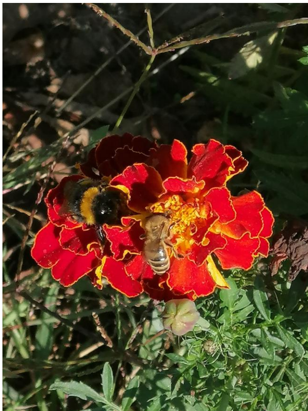
III miejsce - Pszczołę miodna i trzmiel na aksamitce (Autor: Julia Wiktoria Seredyn)