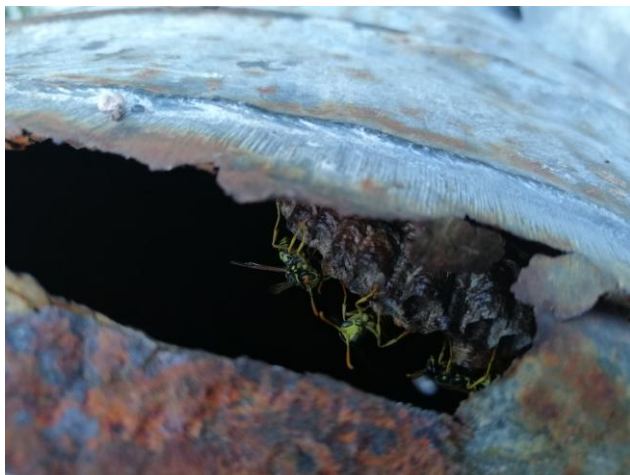
I miejsce - Osy pracujące przy budowie swojego gniazda. (Autor: Michał Seredyn)