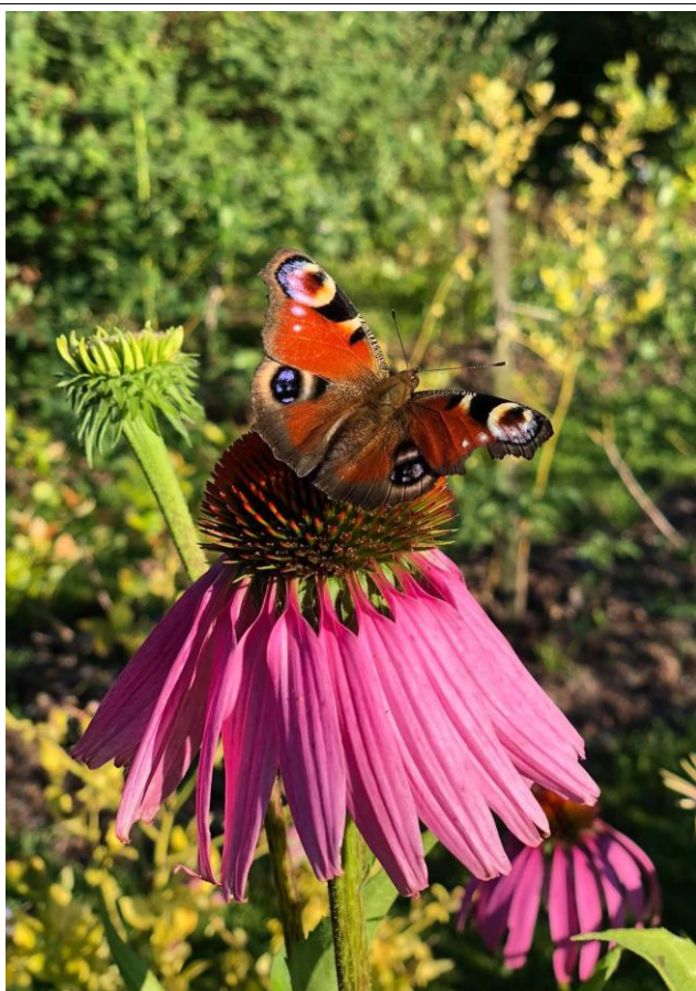
Wyróżnienie - Rusałka pawik na jeżówce purpurowej (Autor: Barbara Gontarek)