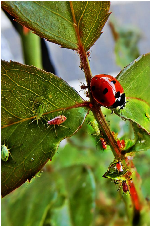
I miejsce - Biedronka żerująca na mszycach