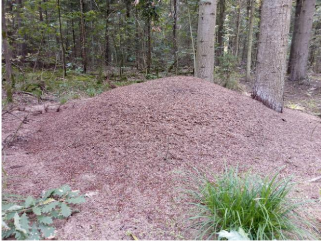
Wyróżnienie: Efekt pracy mrówek rudnic - mrowisko