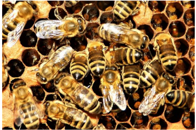
II miejsce - Pszczoły pracujące w ulu