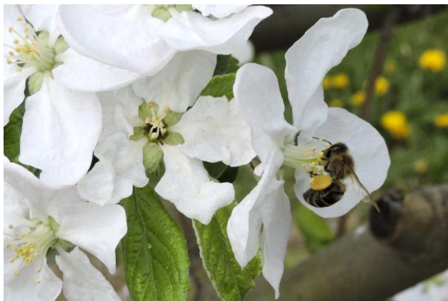
III miejsce - Pszczoła miodna i efekt jej pracy w koszyczkach