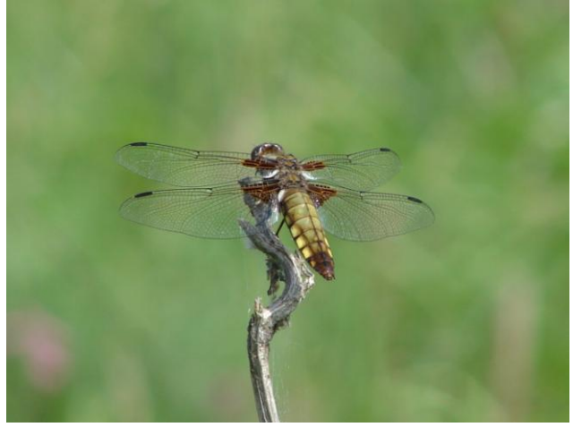
Wyróżnienie: Czatuująca ważka