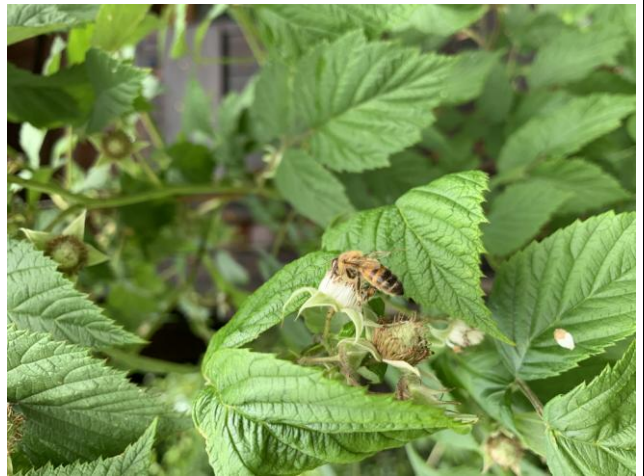
Wyróżnienie - Pszczoła miodna zapylająca kwiatostan maliny (Autor: Joanna Budniak)