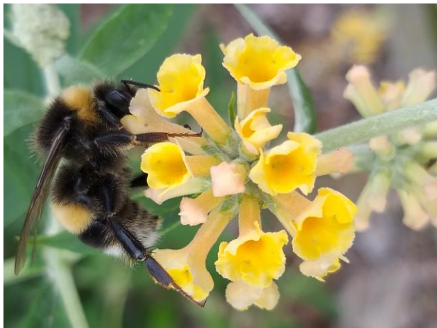
II miejsce - Trzmiel zapylający pierwiosnkę.