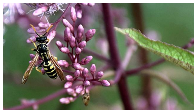
Wyróżnienie - Błonkówka z rodziny osowatych (Autor: Andrzej Kozłowski)