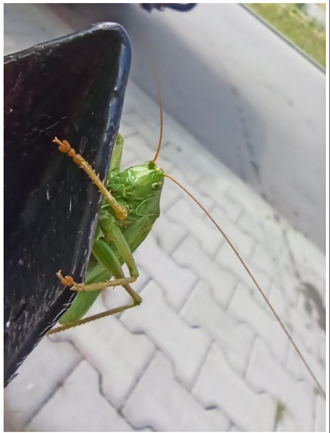
Wyróżnienie - Pasikonik zielony w nietypowym środowisku (Autor: Barbara Nabożny - Adamiec)