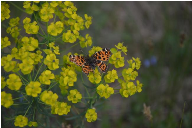
Wyróżnienie - Rusałka kratkowiec (Autor: Jelena Jasek)