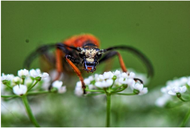
Wyróżnienie - Chrząszcz obsypany pyłkiem służącym do zapylania