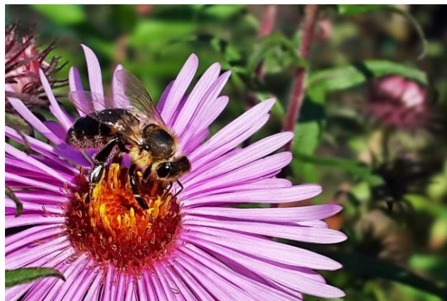
Wyróżnienie - Pszczoła samotnica na astrze (Autor: Wacław Laskowski)