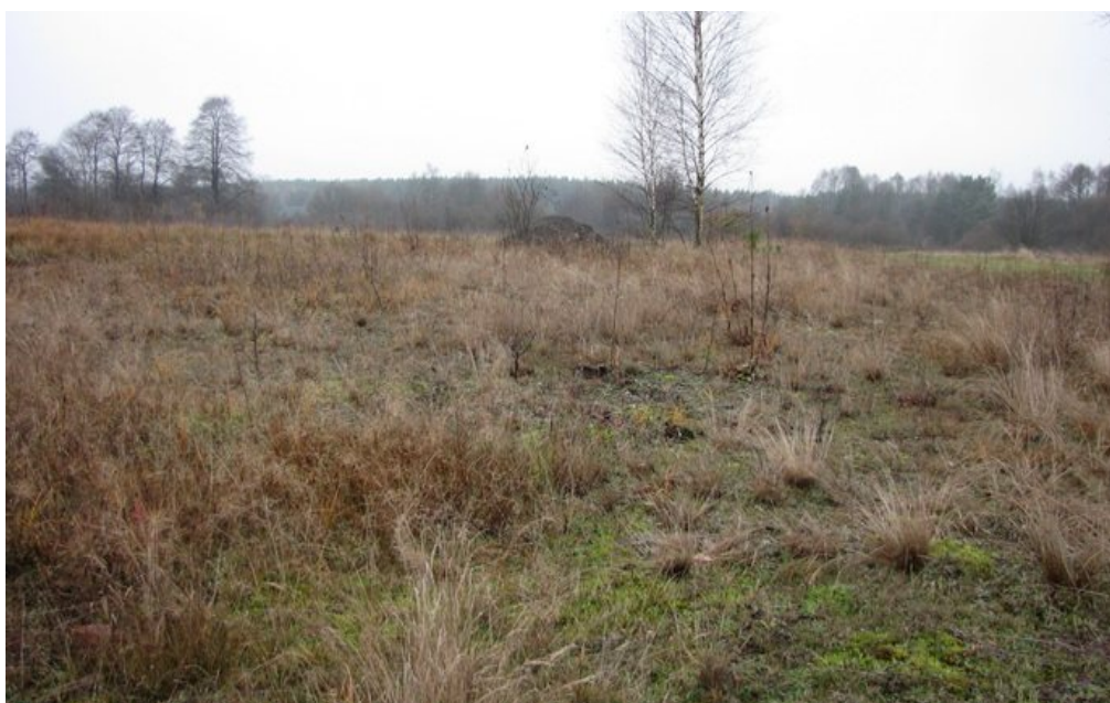
Fot. 1. Składowanie materiałów budowlanych na chronionym siedlisku – ciepłolubnej murawie napiaskowej