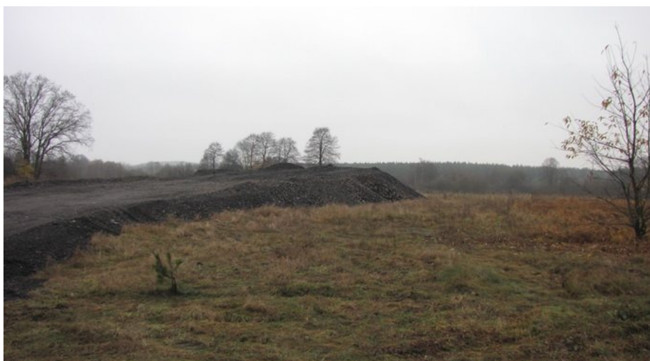
Fot. 2. Widok składowiska – teren pradoliny rzeki Pilicy.