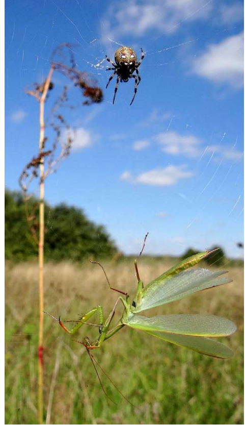
Fot. 2. Samiec modliszki Mantis religiosa w sieci pająka Araneus quadratus, Pakosław EB17.

no ootekę na torfowisku, pośród turzyc Carex L., pędów żurawiny Vaccinium oxycoccus L. i torfowców Sphagnaceae Dumort. (Rez. Okólny Ług EB39) (fot. 1). Modliszka zwyczajna systematycznie powiększa swój areal występowania i należy się spodziewać, że w ciągu kilku lat zasiedli większą część obszaru Polski. Naturalnym czynnikiem ograniczającym rozwój gatunku są niekorzystne warunki atmosferyczne panujące zimą. Dorosłe osobniki giną przy ujemnych temperaturach, chociaż mogą przeżyć przygruntowe przy-