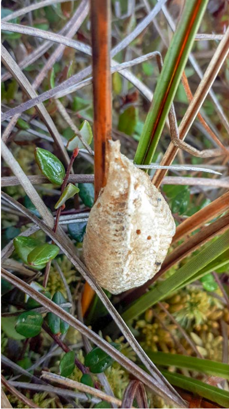
Fot. 1. Ooteka modliszki Mantis religiosa na torfowisku, rez. Okólny Ług EB39.

Photo 1. Oothecium of European mantis Mantis religiosa on a mire in Okólny Ług nature reserve EB39 (photo by E. Nowicka on 27.10.2019).