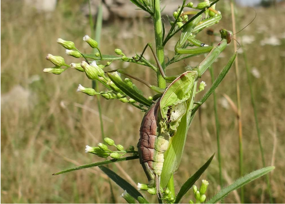
Fot. 3. Teratologiczna samica modliszki Mantis religiosa, Wysokie Koło EC50.